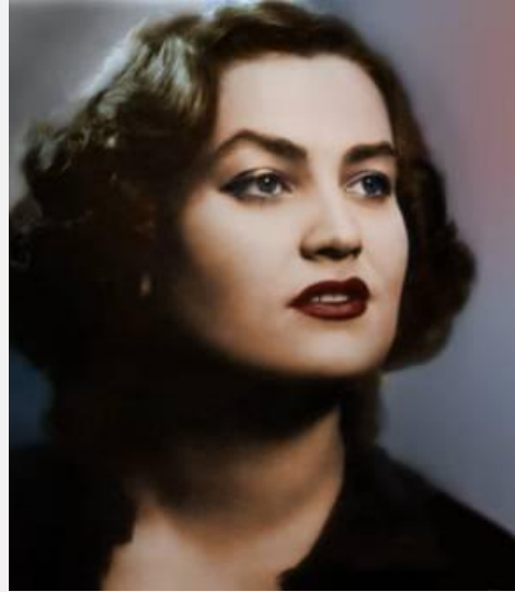
Mualla Mukadder Atakan

Bu inceleme için seçilen birinci kişi bir zamanlar Türk sanat müziğinde başarılı ve ünlü olmuş ama hayatında bazı sorunların da yer aldığı bir kadın sanatçı olacaktır. Batı ve Vedic sistemlerinde analizi yapılacak olan kadın sanatçı Mualla Mukadder Atakan olacaktır.